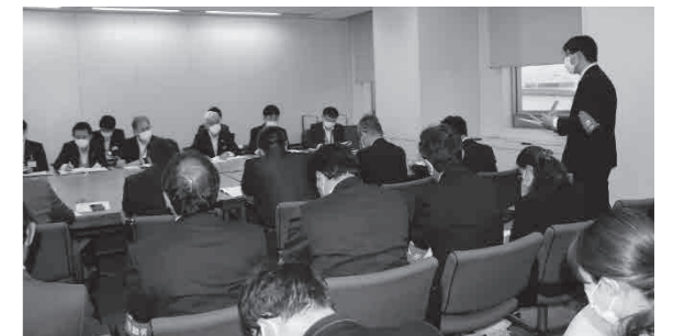
県職連交渉の様子(昨年度)

人事委員会勧告の概要、県知事・県教育長あて要求書の内容については、今後の教育新聞でお知らせします。