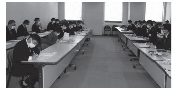
県教委交渉の様子(昨年度)