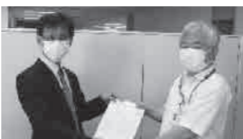
要請書を提出する小演執行委員長

今後、県教委が策定する「指標」の内容が「新たな研修」の内容に大きく影響することになります。10月5日、県教組は県教育長あて要請書を提出するとともに、県教委が策定する「指標」を学校現場の状況をふまえた内容とするよう要請を行いました。