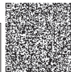
申し込み QR コード