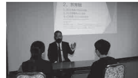
面接練習後の参加者へのアドバイス

第4回 7月22日(土)14:00～16:15 集団面接のポイント・集団面接練習