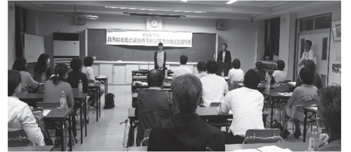
碓氷地区定期総会