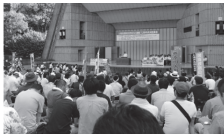
昨年の中央行動の様子

県教組・日教組は人事院への要求実現に向けて、公務員連絡会の仲間たちとともに、「全職員の賃上げと処遇改善を求める」団体署名と「全職員の賃上げと処遇改善を求める」団体決議にとりくんでいます。