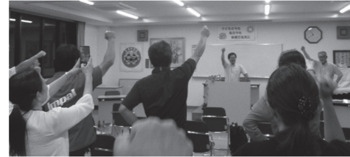
甘楽地区定期総会