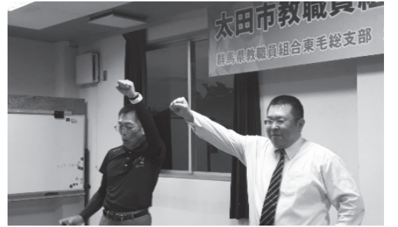
太田地区定期大会