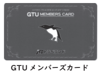
GTUメンバーズカード

ご利用には GTUカードの提示が必要です ・ユーザー登録は県教組組合員のみ可能です。 ・宿泊時に受付で「GTUカード」の提示が必要ですので、忘れずにお持ちください。 (※裏面に職員番号と氏名を明記してください)