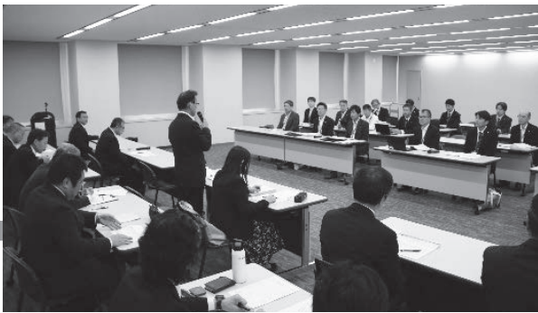
県教委交渉（手前が県教組、奥が県教委）