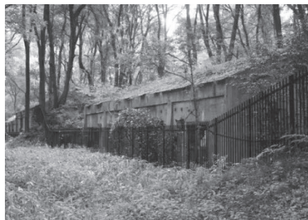
日本火薬株式会社工場内に残る旧火薬製造所跡

追悼碑撤去跡を見学した後は、今も残る旧岩鼻火薬製造所の建物などを見て回りました。岩鼻火薬製造所は旧陸軍の火薬工場として黒色火薬を製造していました。公園内には、爆破事故が起きたときに危険を防止するために、多くの土塁をつくって樹木を植えたそうです。その土塁と樹木が今も公園内のあちらこちらに残っています。群馬の森のような私たちに身近な場所にも戦時中の史実を知る資料がいくつも残っていることに驚かされました。皆さんも群馬の森を訪れた際には、探索してみたらどうでしょう。